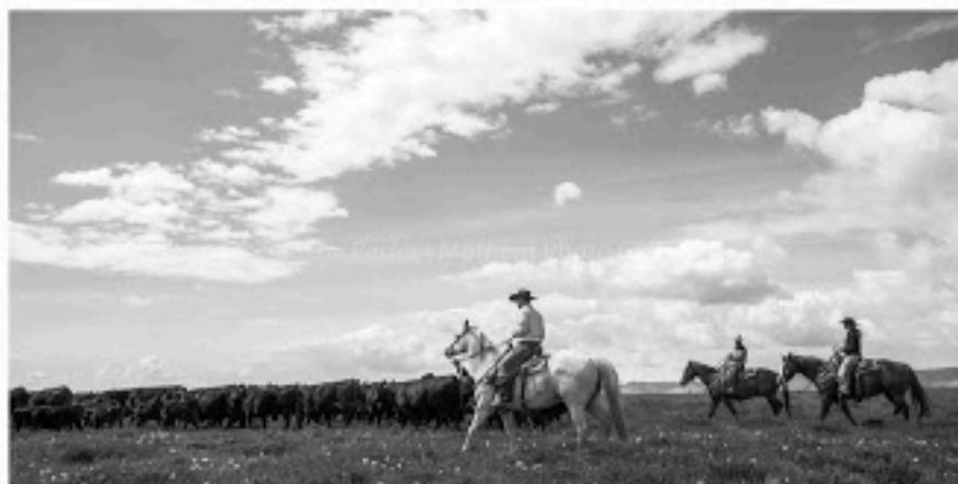
Les derniers cow-boys du Wyoming continuent de travailler à cheval

Les deux photographes français travaillent sur l'ouest américain, ses chevaux, ses ranchs, ses cow boys. Oui, il y en a encore de vrais cow boys qui s'efforcent de vivre selon la tradition. C'est à cheval qu'ils poussent toujours devant eux les sombres troupeaux de centaines de bovins et le lasso reste leur outil de prédilection.