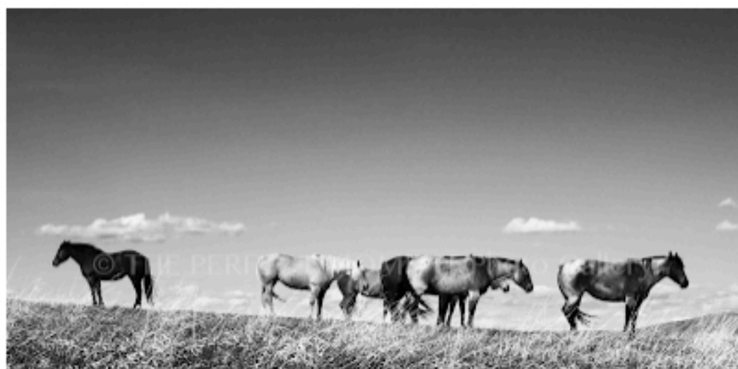
Les mustangs sauvages du Wyoming

Elle est folle de chevaux sauvages et de grands espaces. Pour moi, elle est Poupie ou Isabelle Arnon, son ancien nom. C'était ma photographe lorsque je travaillais à Cheval Magazine. Ensemble, nous avons arpenté les élevages, les écuries de propriétaires comme les poney clubs, les salons, les terrains de concours... Je l'ai quittée célibataire, toujours habillée de jeans et exclusivement chaussée de santiags hiver comme été, passionnée par les photos en noir et blanc. Je la retrouve mariée, en santiags comme d'habitude et toujours aussi dingue de photos en noir et blanc.